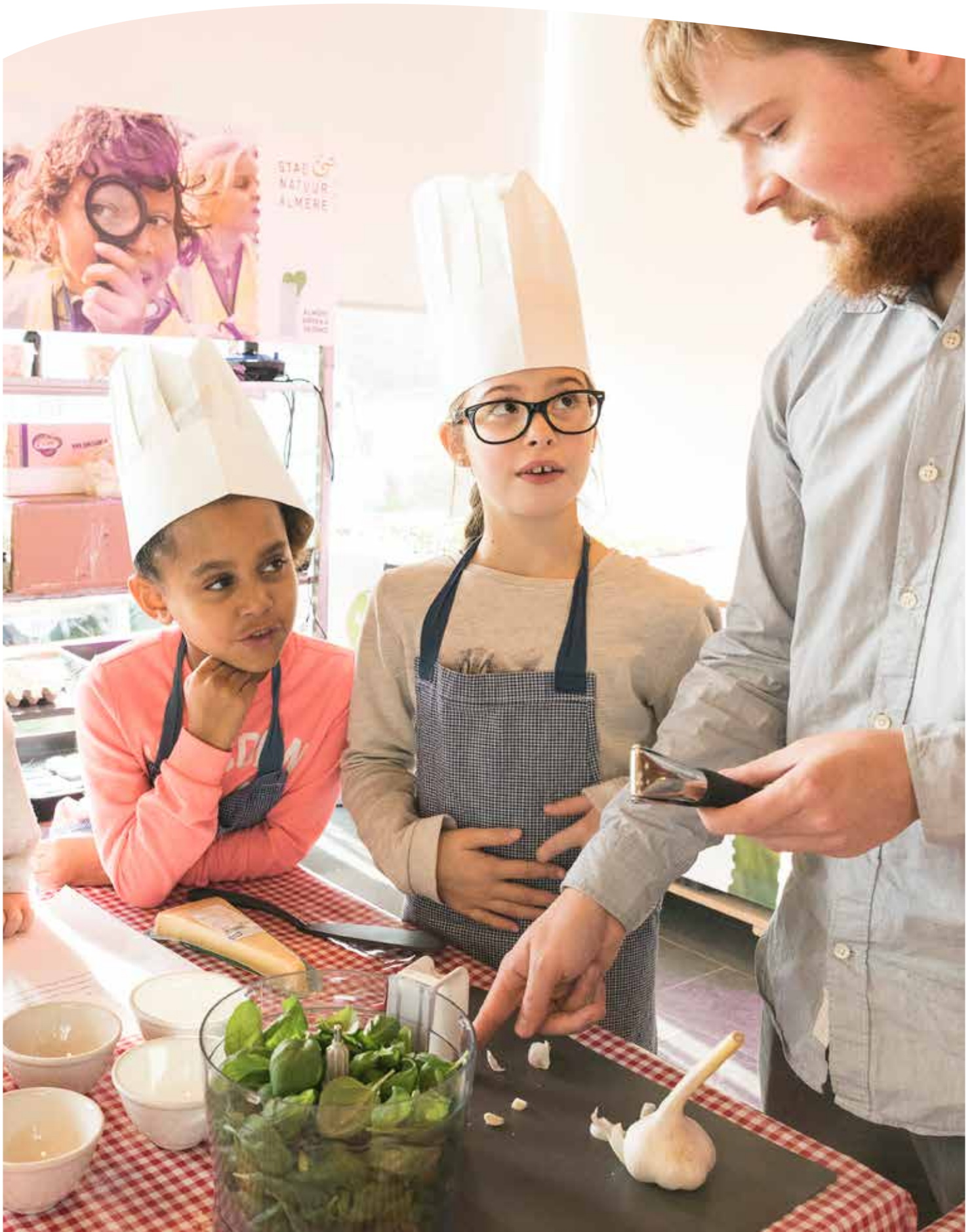
Het lesprogramma mobiele moestuin wordt doorontwikkeld door studenten hbo Engineering en mbo Toegepaste Biologie.