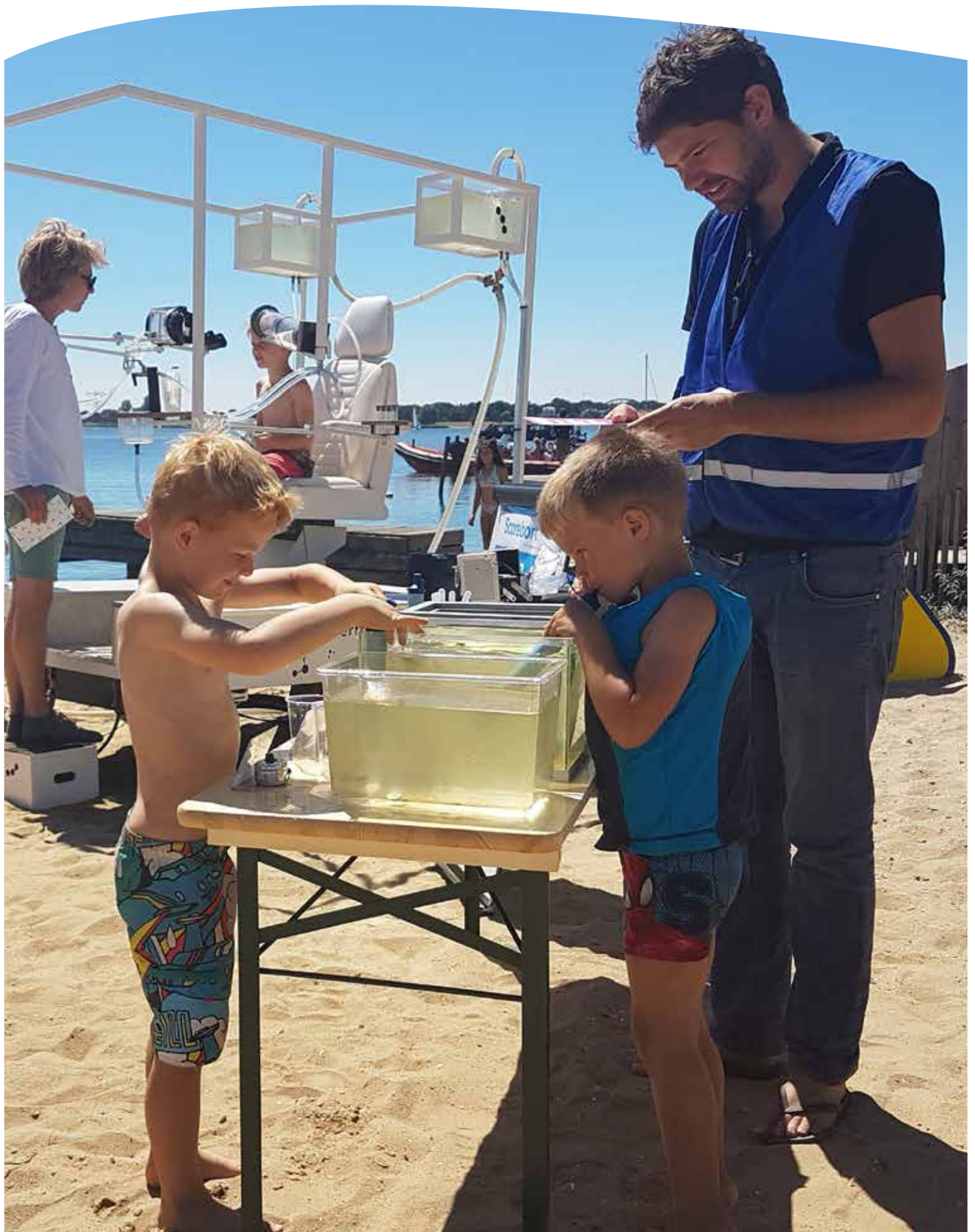
Meer dan 200 bezoekers bezochten de wateractiviteiten op het Almeerderstrand.