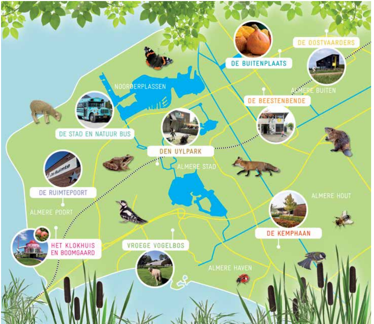
Locaties Stad & Natuur Almere