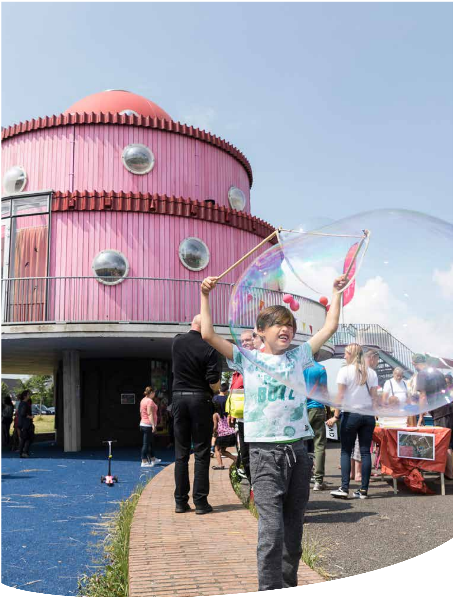
Stad & Natuur ontving eind 2018 een doorlopende evenementenvergunning voor alle locaties.