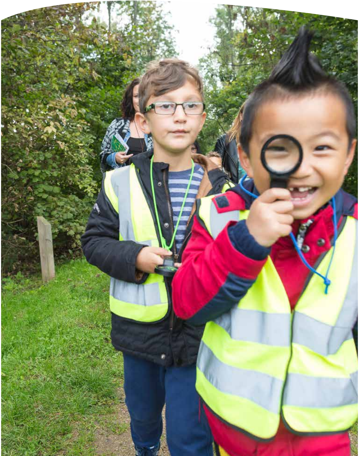
Zelf op onderzoek uit gaan in de natuur!