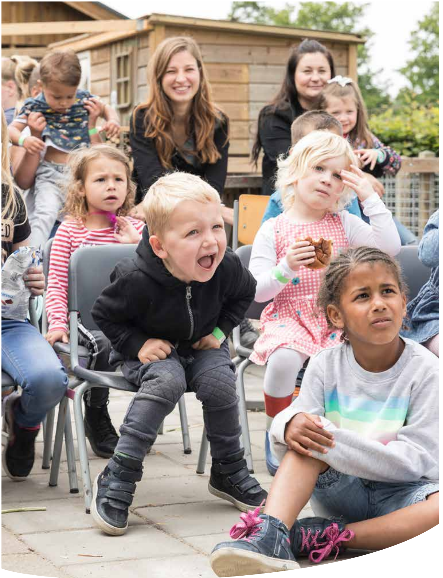
De Lentefeesten op de Kinderboerderijen zijn goed bezocht door gezinnen met kinderen.