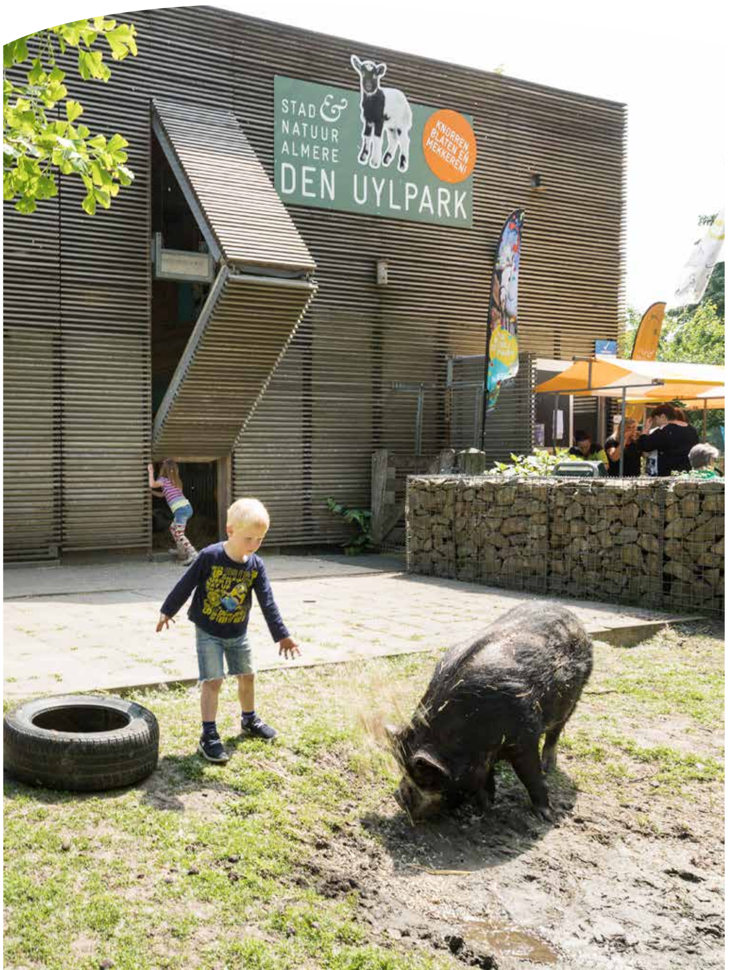
In 2018 bestond Kinderboerderij Den Uylpark 10 jaar!