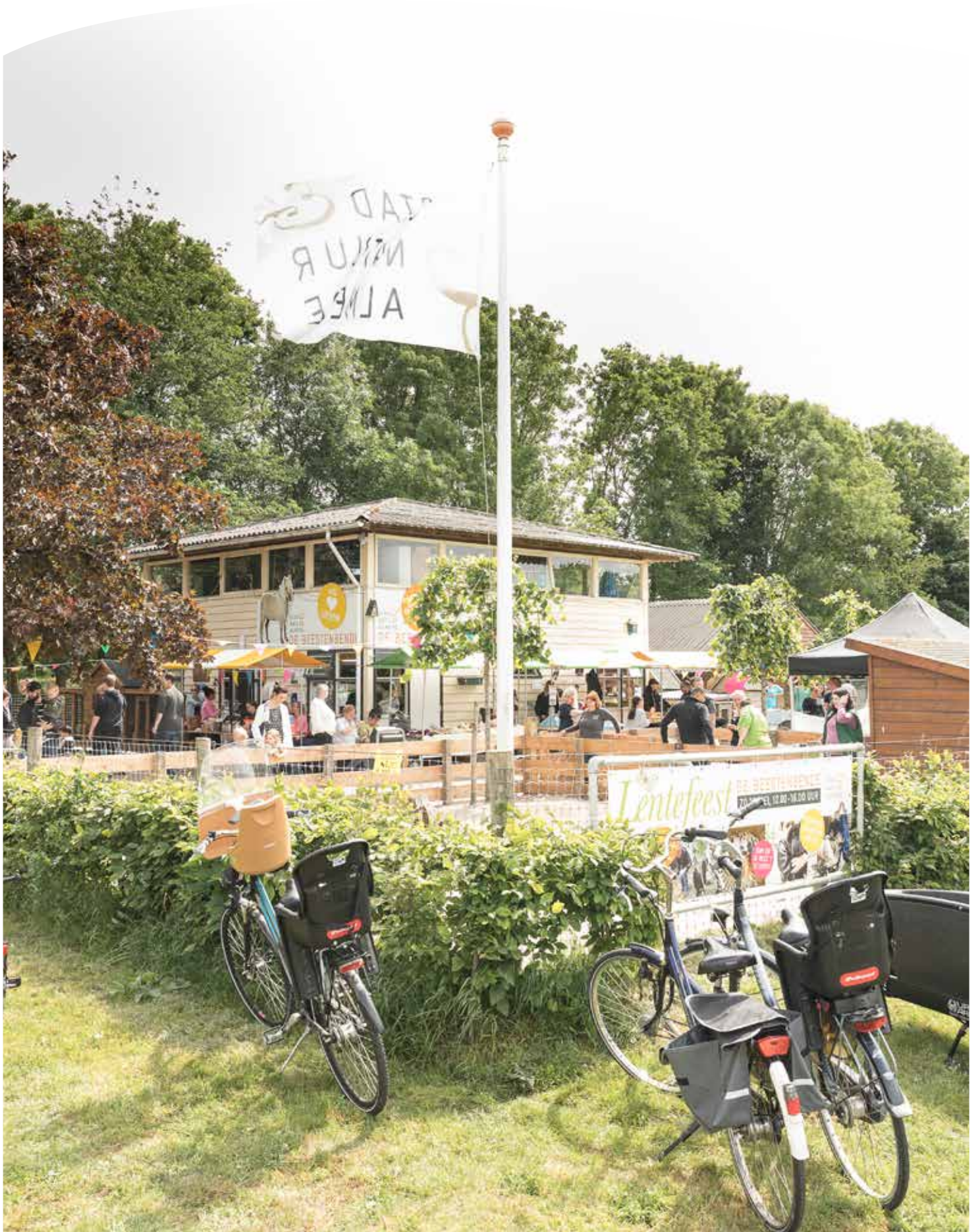
Het gebouw van Kinderboerderij de Beestenbende is toe aan renovatie.