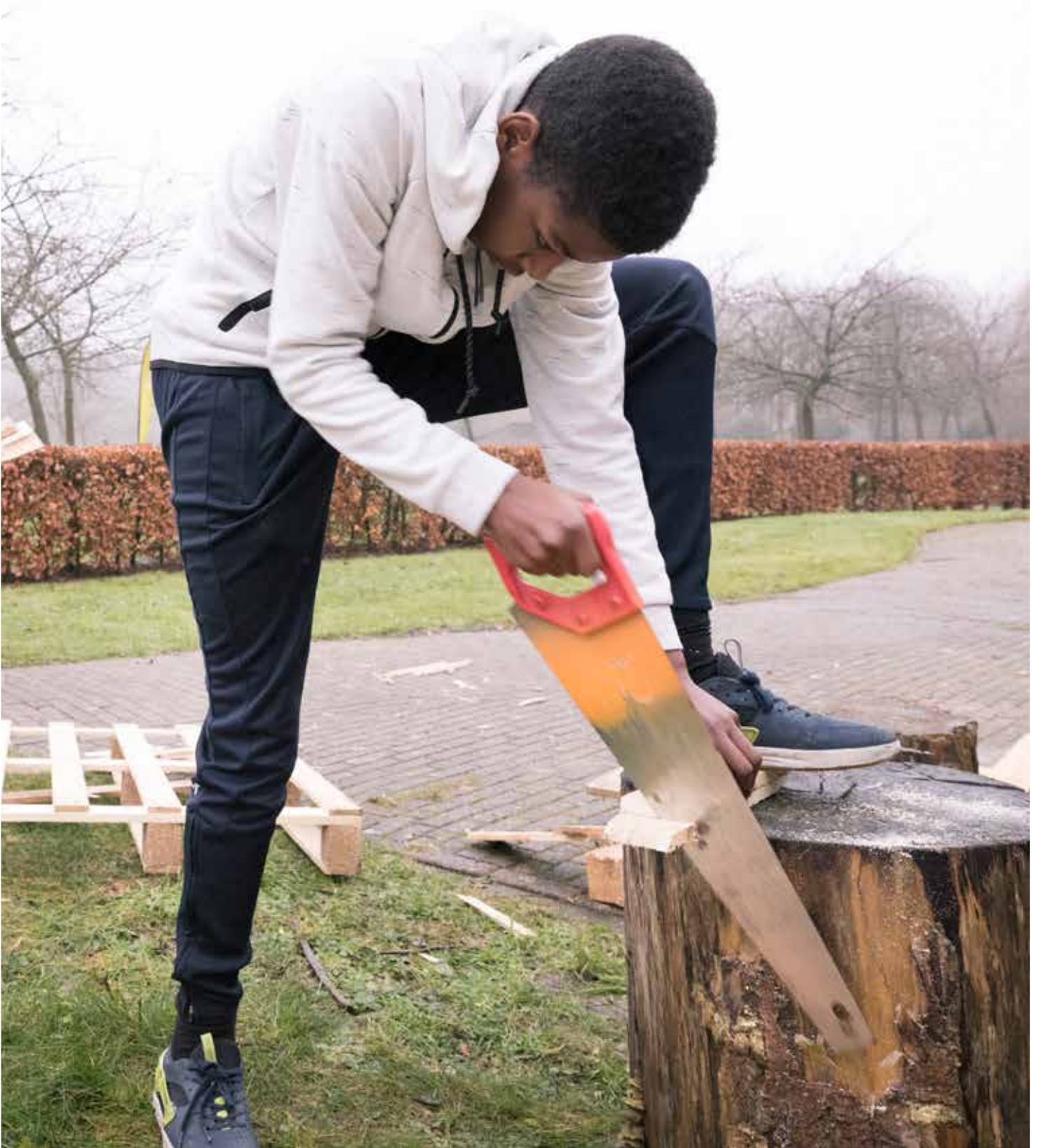
Loopbaan oriëntatie via Almere On Stage en JINC Almere.