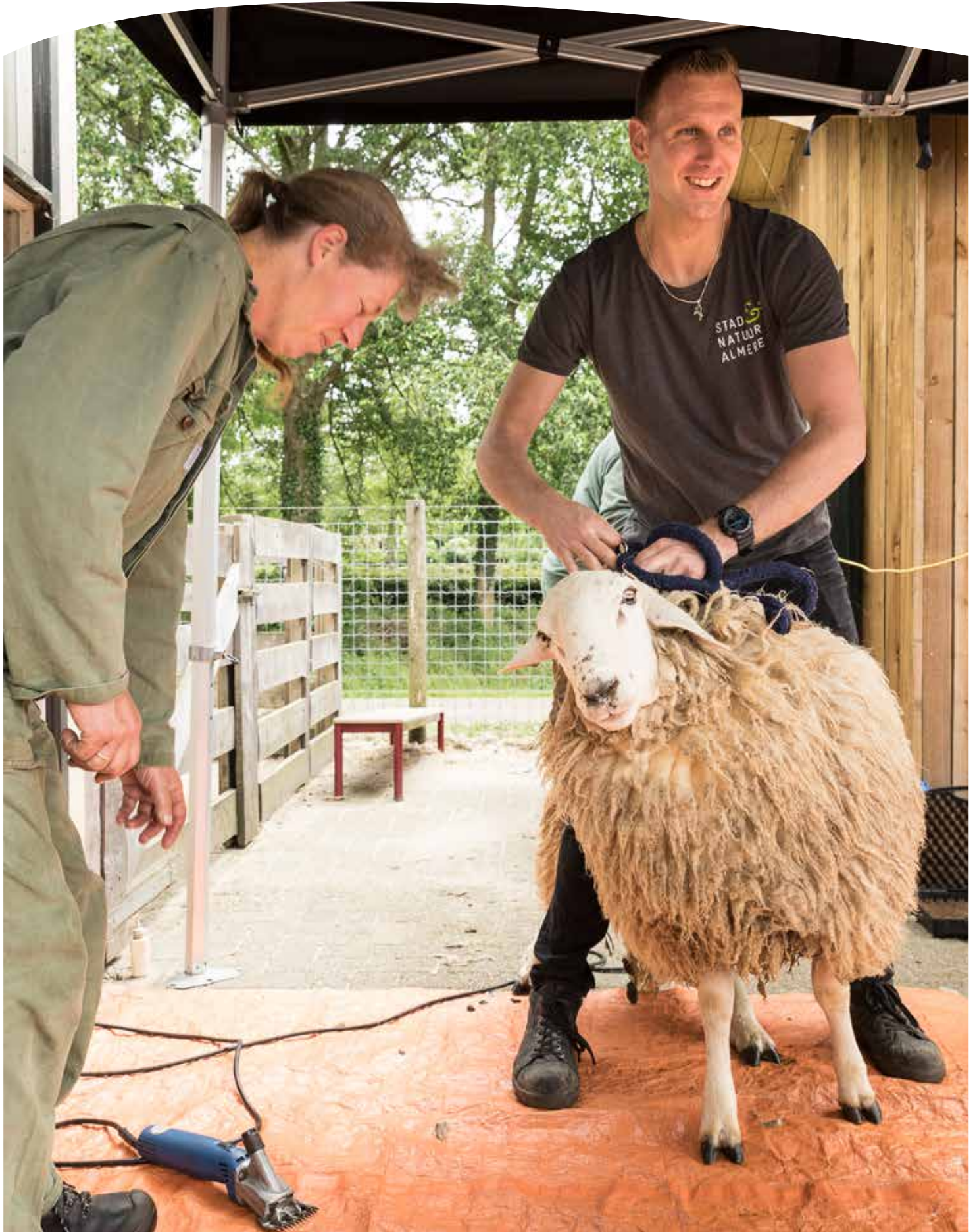
Vrijwilligers helpen op de kinderboerderijen met openstelling, maar ook met activiteiten als het Lentefeest.