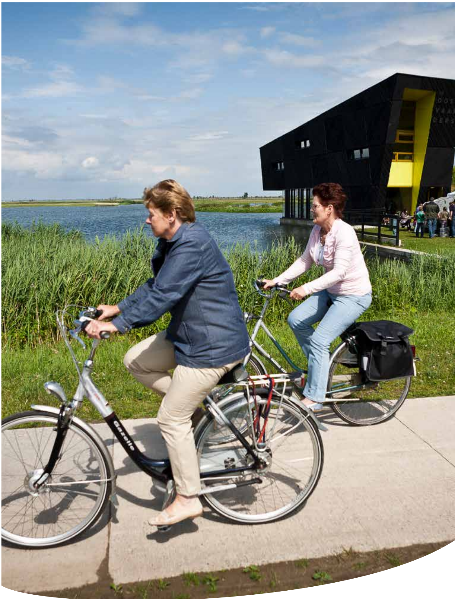
Natuurbelevingcentrum de Oostvaarders wordt doorontwikkeld als toegangspoort voor Nationaal Park Nieuwland.